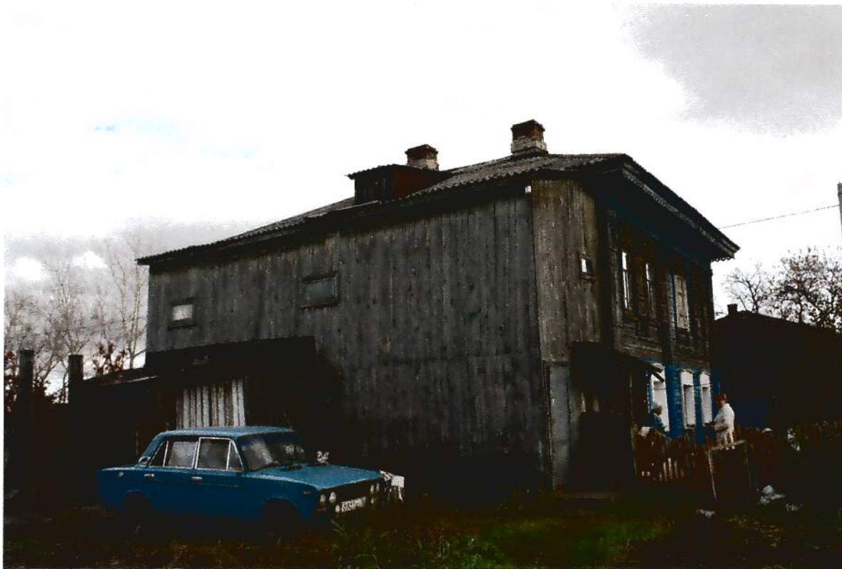
3. Дом жилой (конец XIX в.), Омская область, г. Тара, ул. Избышева, 16, вид северо-восточного фасада.