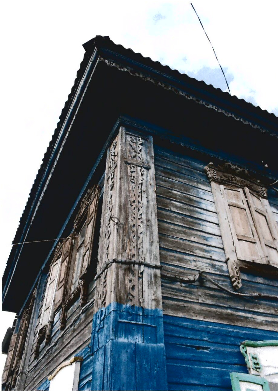
7. Дом жилой (конец XIX в.), Омская область, г. Тара, ул. Избышева 16. Фрагмент отделки фасада.