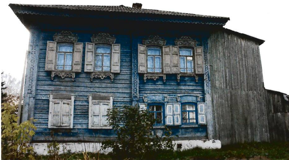
2. Дом жилой (конец XIX в.), Омская область, г. Тара, ул. Избышева, 16, вид северо-восточного фасада.