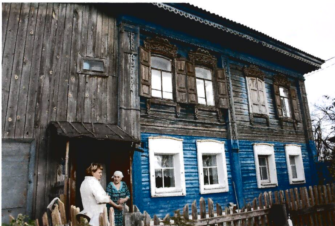
4. Дом жилой дом (конец XIX в.), Омская область, г. Тара, ул. Избышева, 16, вид юго-западного фасада.