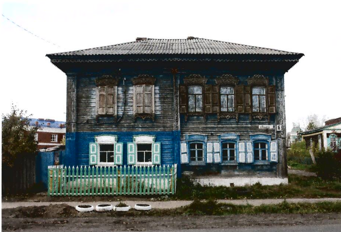
1. Дом жилой (конец XIX в.), Омская область, г. Тара, ул. Избышева, 16, вид юго-восточного фасада.