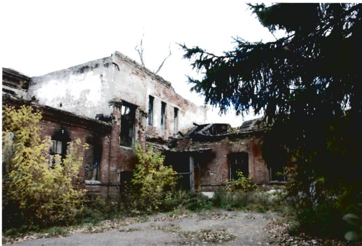
5. Ансамбль зданий Казенного винного склада: Производственное помещение, 1898-1902 гг., Омская область, г. Тара, ул. Советская, 75.