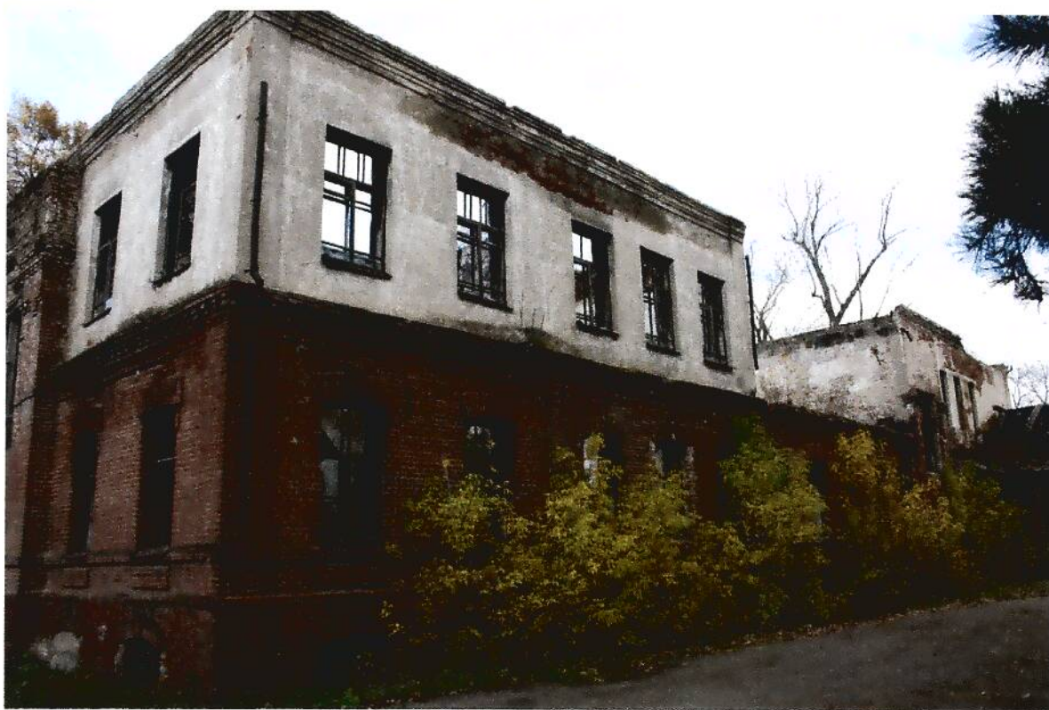
2. Ансамбль зданий Казенного винного склада: Производственное помещение, 1898-1902 гг., Омская область, г. Тара, ул. Советская, 75.