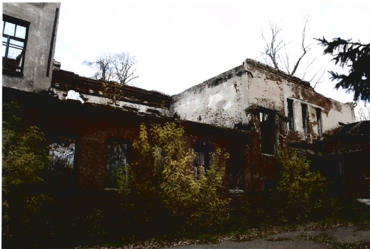
4. Ансамбль зданий Казенного винного склада: Производственное помещение, 1898-1902 гг., Омская область, г. Тара, ул. Советская, 75.