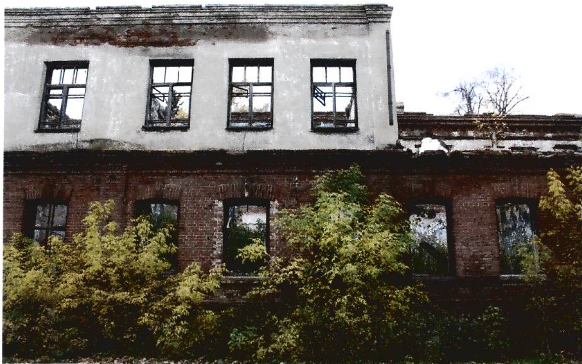
3. Ансамбль зданий Казенного винного склада: Производственное помещение, 1898-1902 гг., Омская область, г. Тара, ул. Советская, 75.