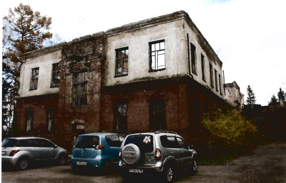
1. Ансамбль зданий Казенного винного склада: Производственное помещение, 1898-1902 гг., Омская область, г. Тара, ул. Советская, 75.