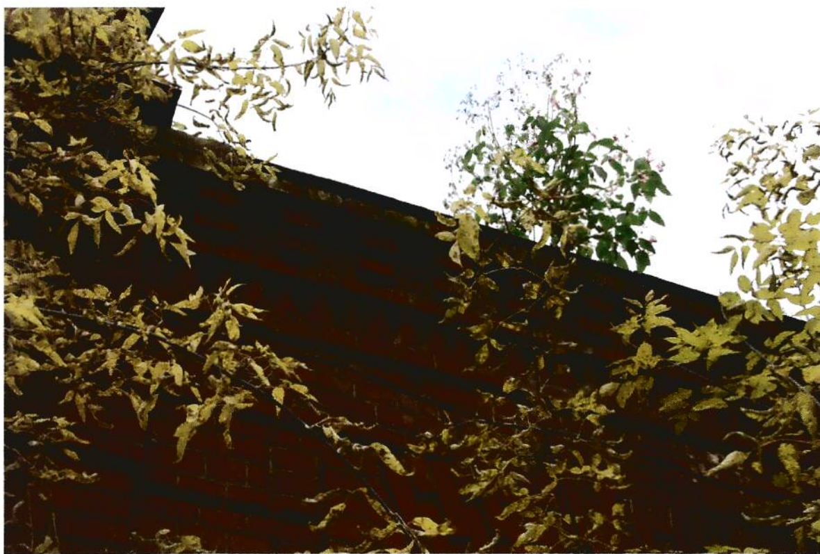
6. Ансамбль зданий Казенного винного склада: Производственное помещение, 1898-1902 гг., Омская область, г. Тара, ул. Советская, 75.