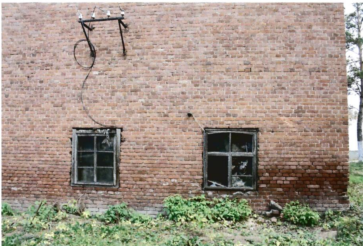
3. Ансамбль зданий Казенного винного склада: Навес для подвод и лошадей (1898-1902 гг.), Омская область, г. Тара, ул. Советская, 75.