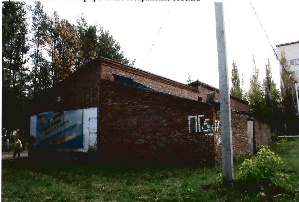
1. Ансамбль зданий Казенного винного склада: Навес для подвод и лошадей (1898-1902 гг.), Омская область, г. Тара, ул. Советская, 75.