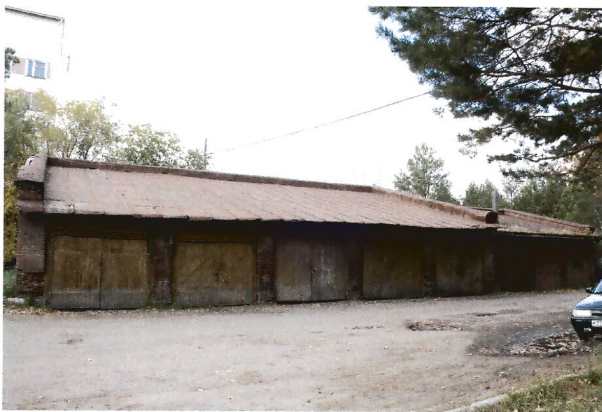
5. Ансамбль зданий Казенного винного склада: Навес для подвод и лошадей (1898-1902 гг.), Омская область, г. Тара, ул. Советская, 75.