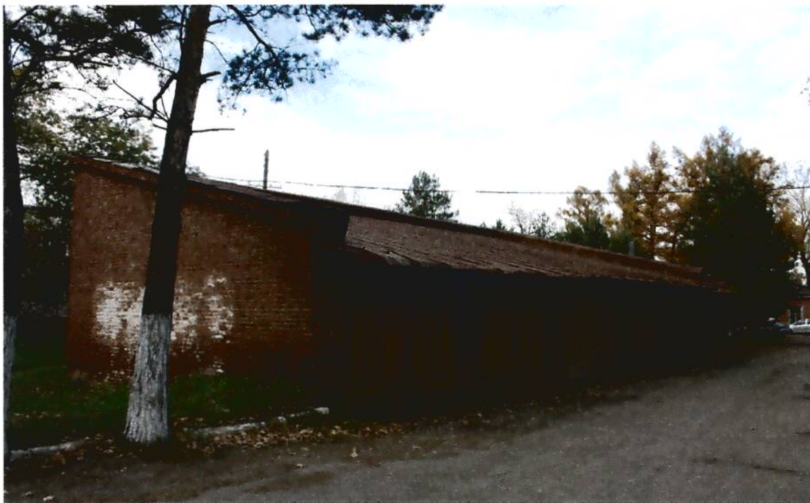
4. Ансамбль зданий Казенного винного склада: Навес для подвод и лошадей (1898-1902 гг.), Омская область, г. Тара, ул. Советская, 75.