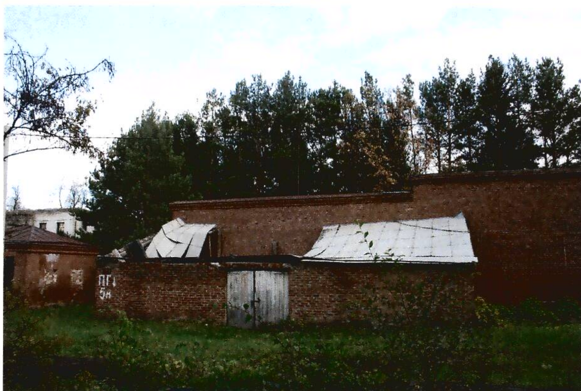
2. Ансамбль зданий Казенного винного склада: Навес для подвод и лошадей (1898-1902 гг.), Омская область, г. Тара, ул. Советская, 75.