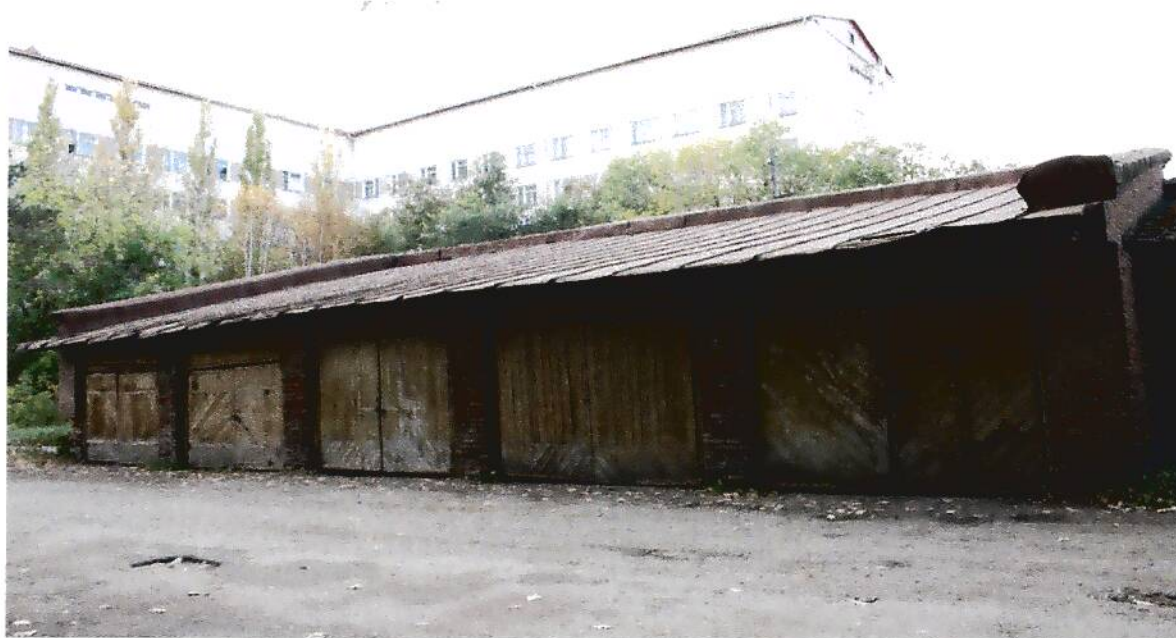
6. Ансамбль зданий Казенного винного склада: Навес для подвод и лошадей (1898-1902 гг.), Омская область, г. Тара, ул. Советская, 75.