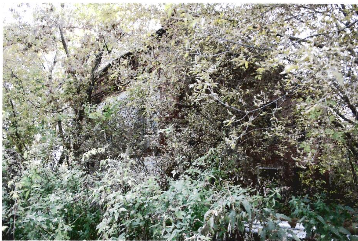
2. Ансамбль зданий Казенного винного склада: Котельная, 1898-1902 гг., Омская область, г. Тара, ул. Советская, 75.