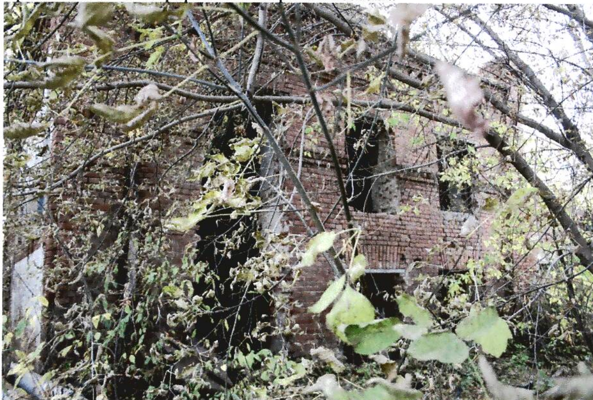
1. Ансамбль зданий Казенного винного склада: Котельная, 1898-1902 гг., Омская область, г. Тара, ул. Советская, 75.