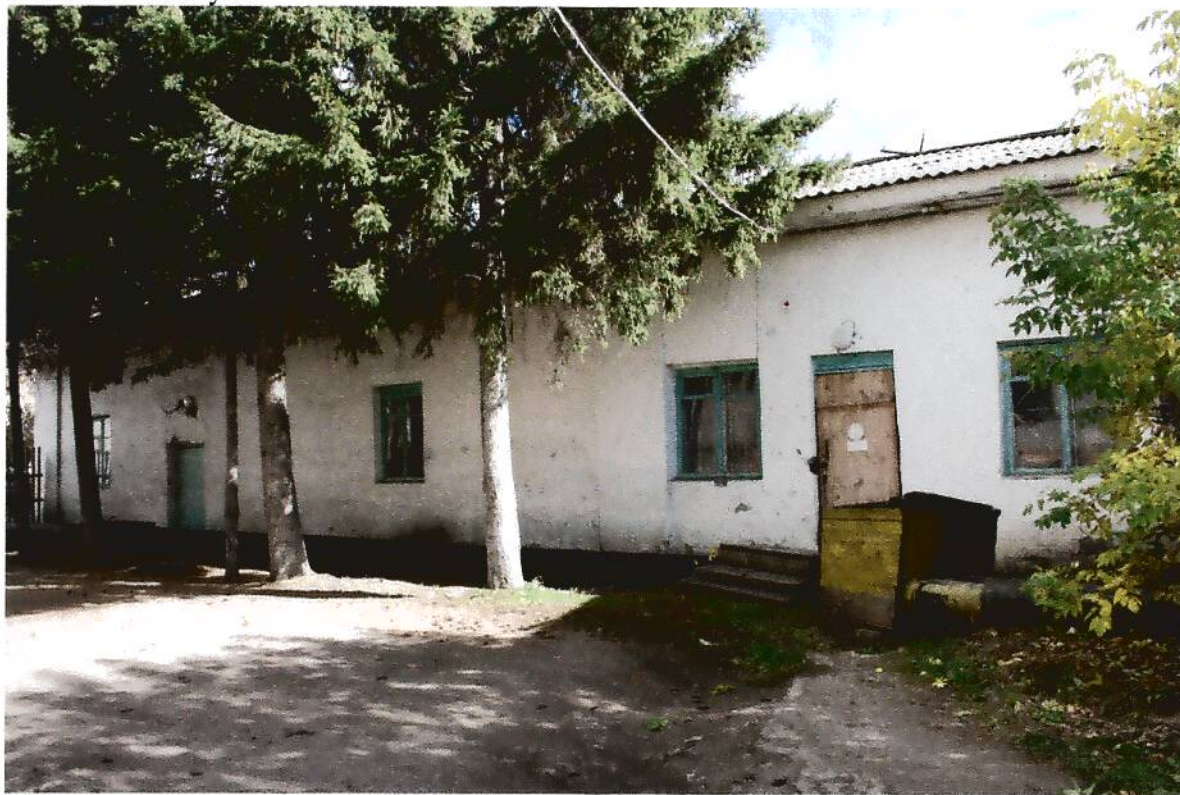
6 . Здание для хозяйственных нужд (склады, конюшня) купчихи Пятковой (XIX в.), Омская область, г. Тара, ул. Советская, 23, вид северо-западного фасада.