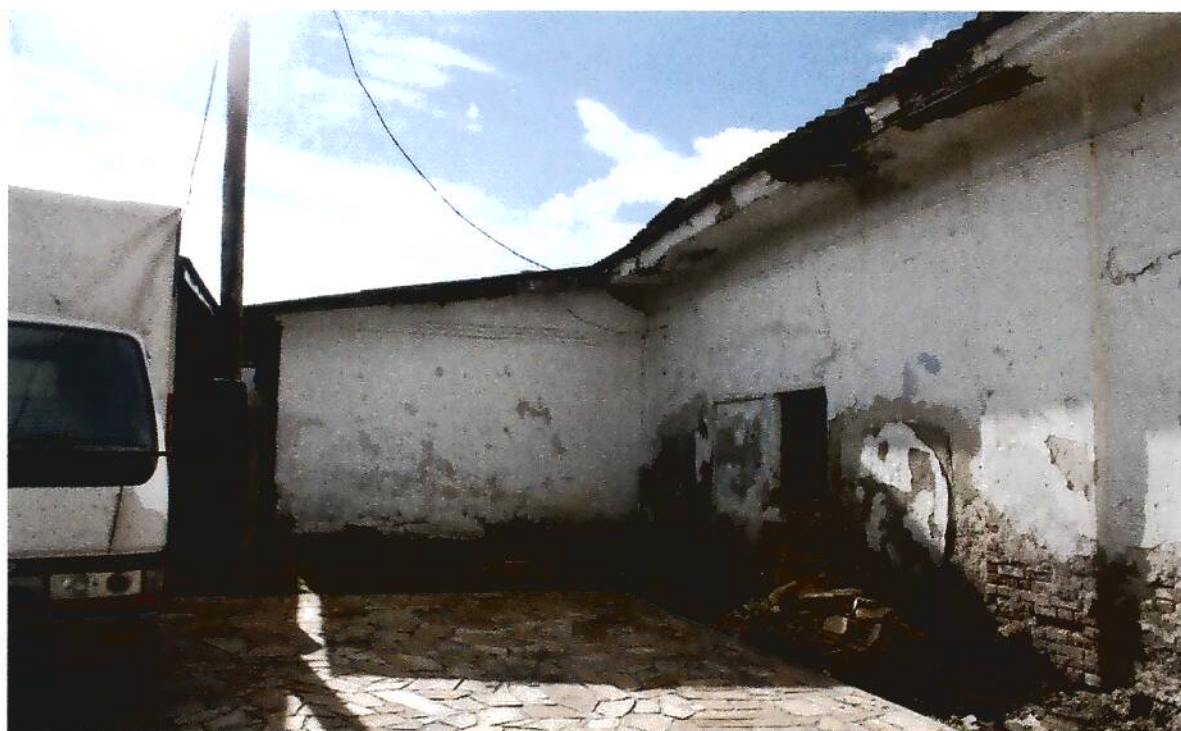
4. Здание для хозяйственных нужд (склады, конюшня) купчихи Пятковой (XIX в.), Омская область, г. Тара, ул. Советская, 23, фрагмент юго-восточного фасада.