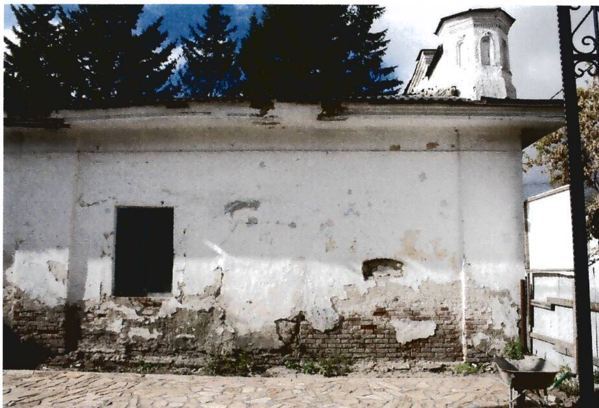
3. Здание для хозяйственных нужд (склады, конюшня) купчихи Пятковой (XIX в.), Омская область, г. Тара, ул. Советская, 23, фрагмент юго-восточного фасада.