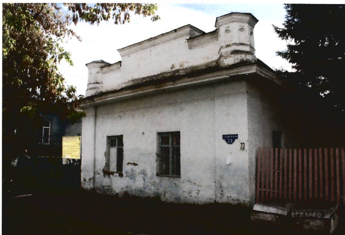
1. Здание для хозяйственных нужд (склады, конюшня) купчихи Пятковой (XIX в.), Омская область, г. Тара, ул. Советская, 23, общий вид в перспективе улицы Советской и окружающей среде, вид северо-восточного фасада.