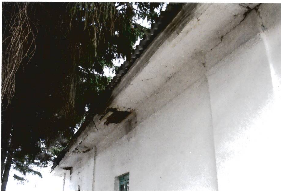
5 . Здание для хозяйственных нужд (склады, конюшня) купчихи Пятковой (XIX в.), Омская область, г. Тара, ул. Советская, 23, фрагмент юго-восточного фасада.