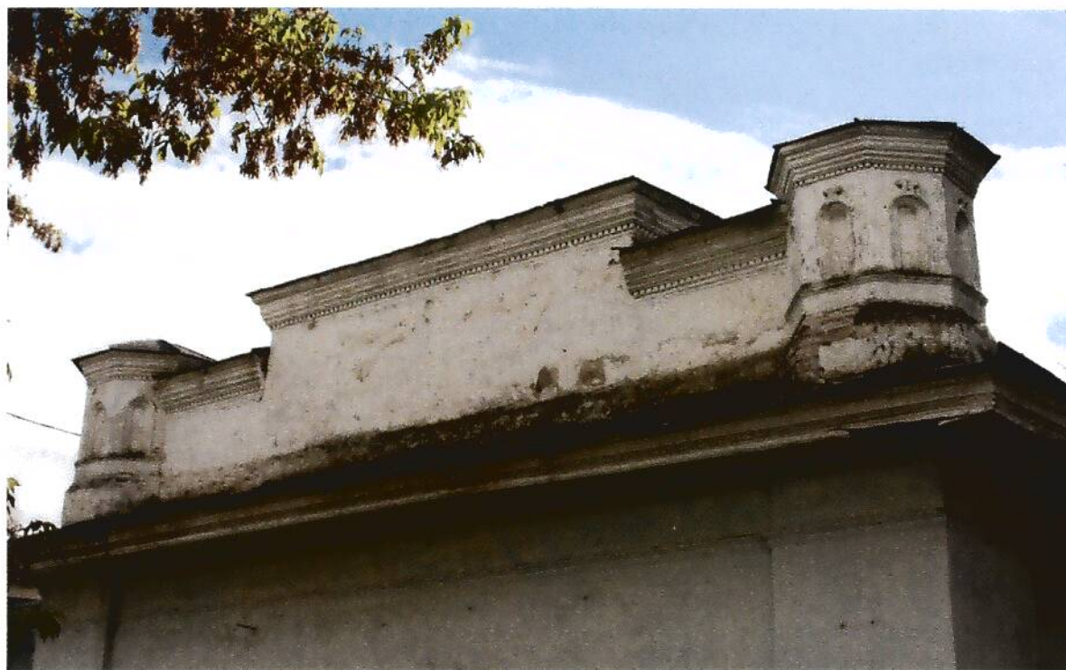
2. Здание для хозяйственных нужд (склады, конюшня) купчихи Пятковой (XIX в.), Омская область, г. Тара, ул. Советская, 23, фрагмент северо-восточного фасада.