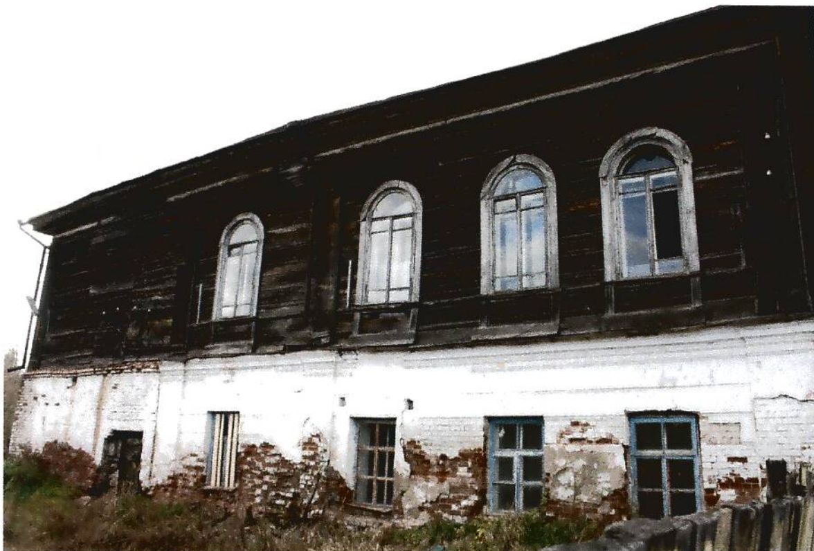
3. Жилой дом купца Айтыкина (XIX в.), Омская область, г. Тара, ул. Нерпинская, 23-а, вид юго-восточного фасада.