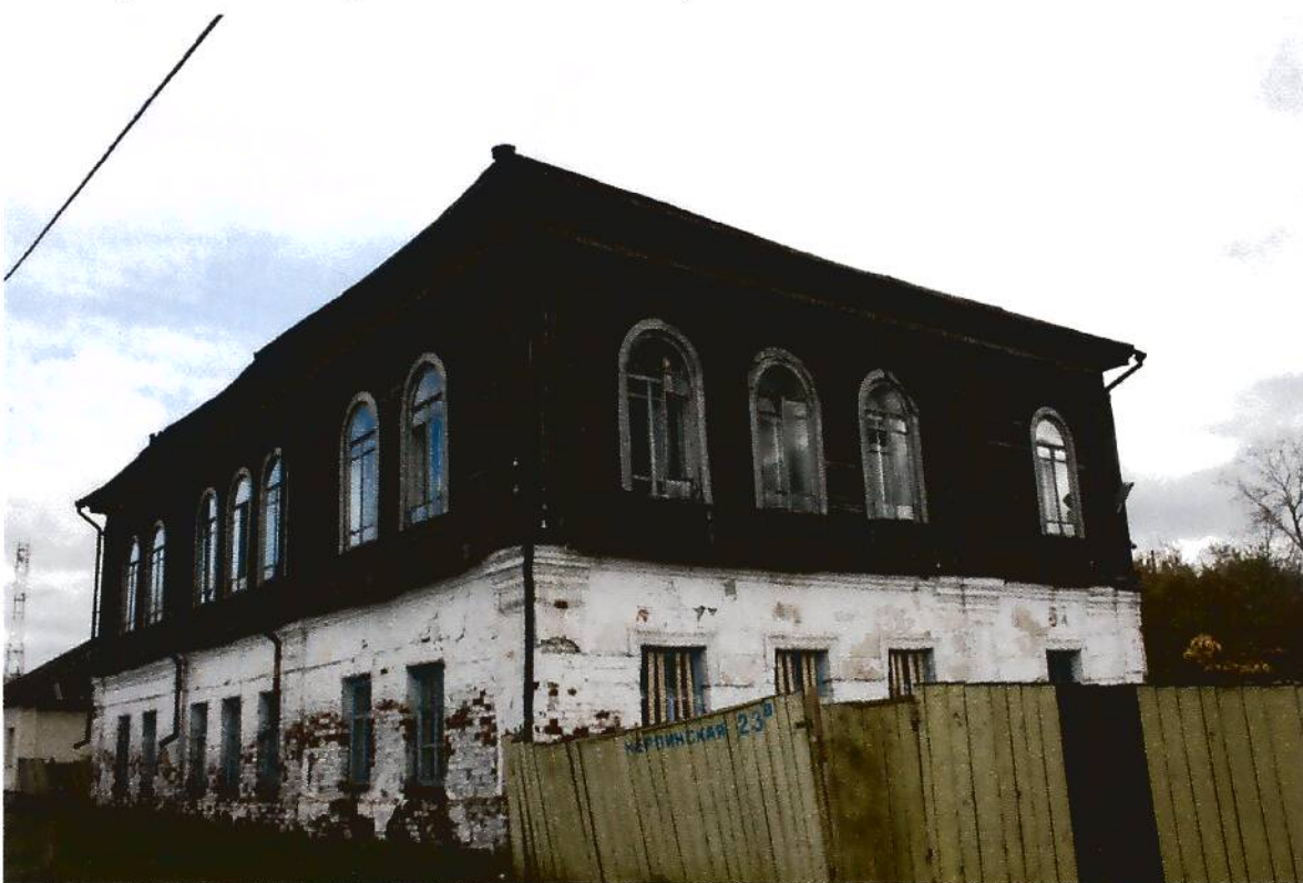
2. Жилой дом купца Айтыкина (XIX в.), Омская область, г. Тара, ул. Нерпинская, 23-а, вид северо-восточного и северо-западного фасадов.