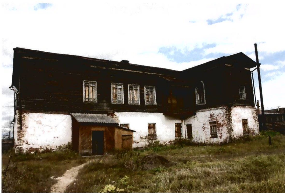
4. Жилой дом купца Айтыкина (XIX в.), Омская область, г. Тара, ул. Нерпинская, 23-а вид юго-западного фасада.