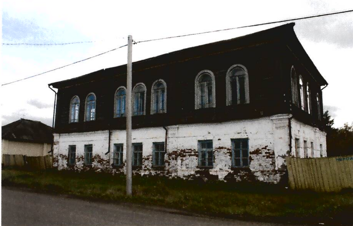
1. Жилой дом купца Айтыкина (XIX в.), Омская область, г. Тара, ул. Нерпинская, 23-а, вид северо-восточного фасада.