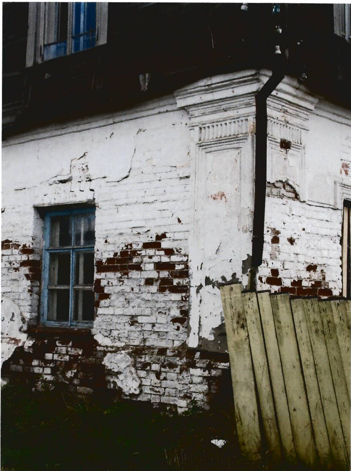
5. Жилой дом купца Айтыкина (XIX в.), Омская область, г. Тара, ул. Нерпинская, 23-а. Фрагмент отделки фасада.